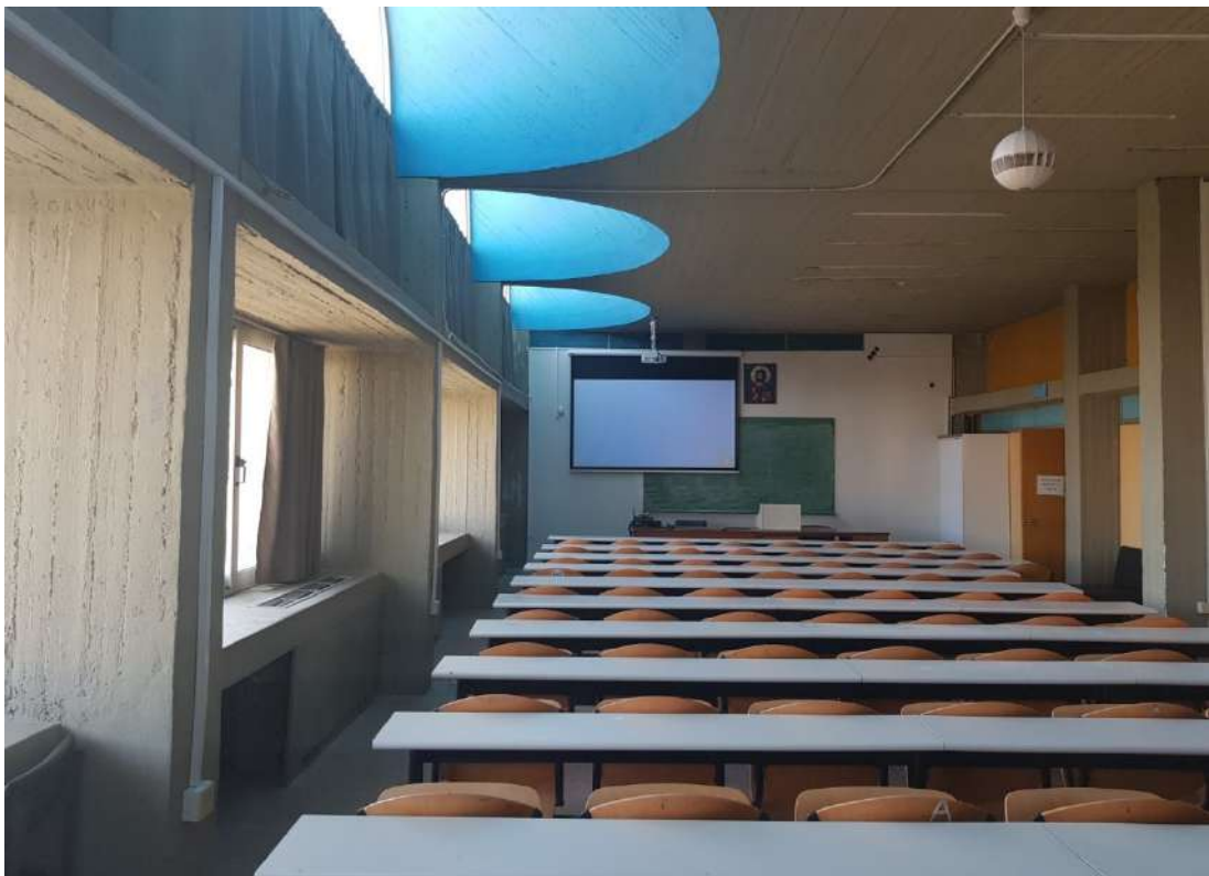
Άποψη του Σπουδαστηρίου με τον πλήρη εξοπλισμό.