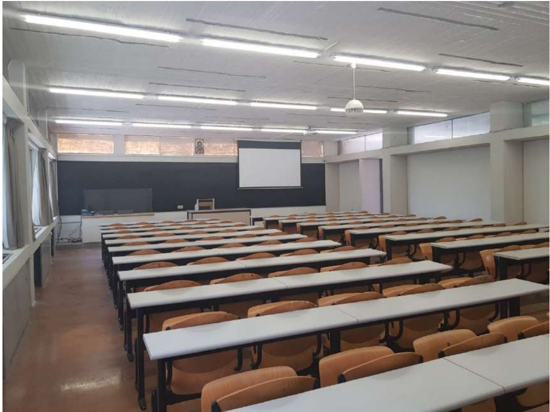
Η ανακαινισμένη και πλήρως εξοπλισμένη Αίθουσα Γ΄.