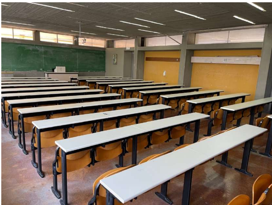
Η Α' Αίθουσα ΠΙΠΙΝ.