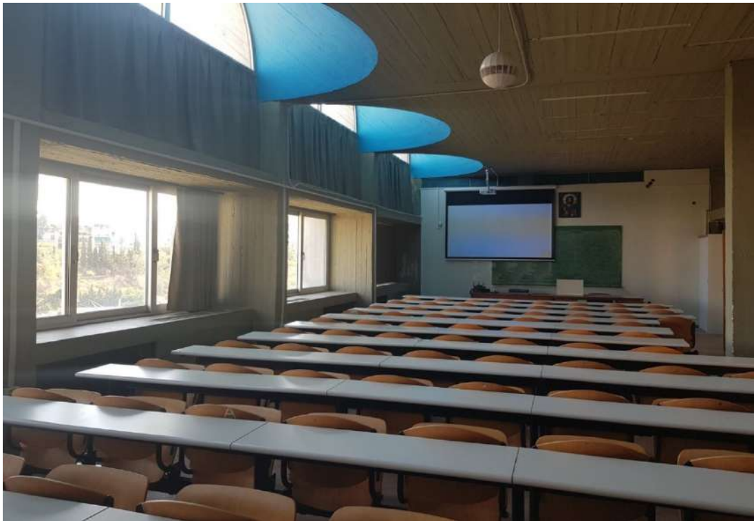
Ένα από τα δύο Σπουδαστήρια, πλήρως εξοπλισμένο με σύγχρονα μέσα διδασκαλίας.