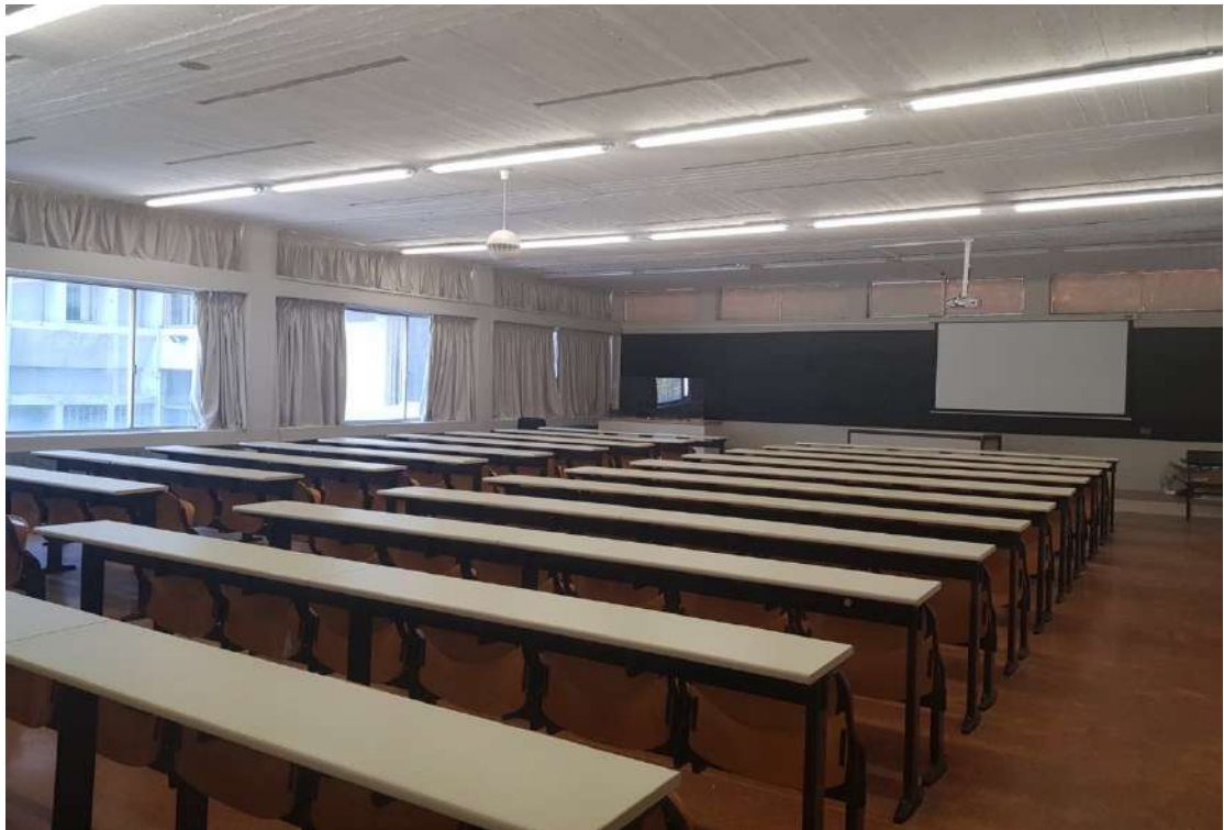
Η Αίθουσα Γ΄ με τις νέες κουρτίνες, τα φωτιστικά σώματα και τον εξοπλισμό διδασκαλίας.