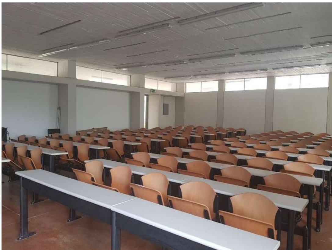
Η ανακαινισμένη Α' Αίθουσα.