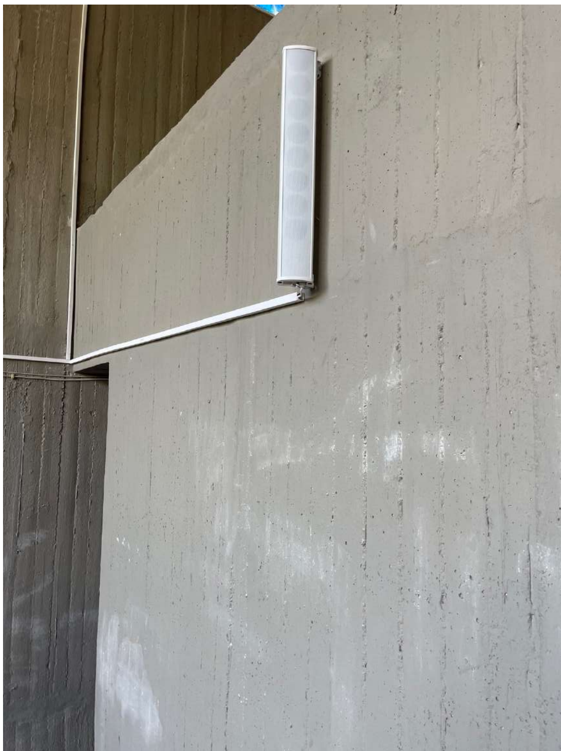
Οι νέες ηχητικές εγκαταστάσεις στο Αμφιθέατρο του Τμήματος Κοινωνικής Θεολογίας.