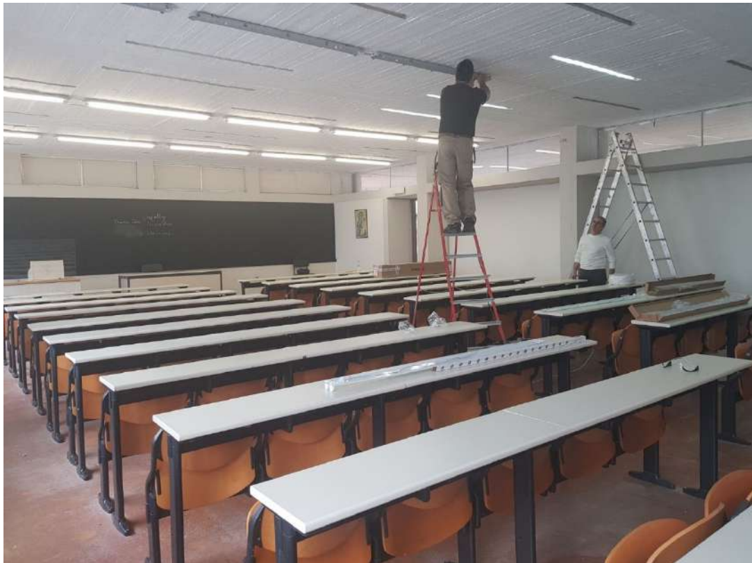
Από τις εργασίες ανακαίνισης της Α' Αίθουσας.