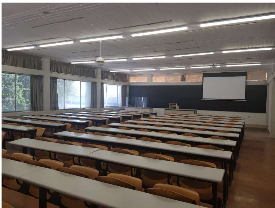
Η Γ' Αίθουσα ΜΕΤΑ.