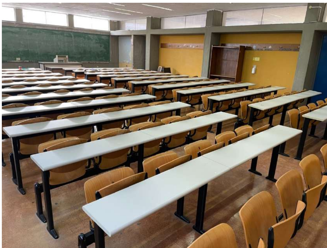
Η Γ' Αίθουσα ΠΡΙΝ.