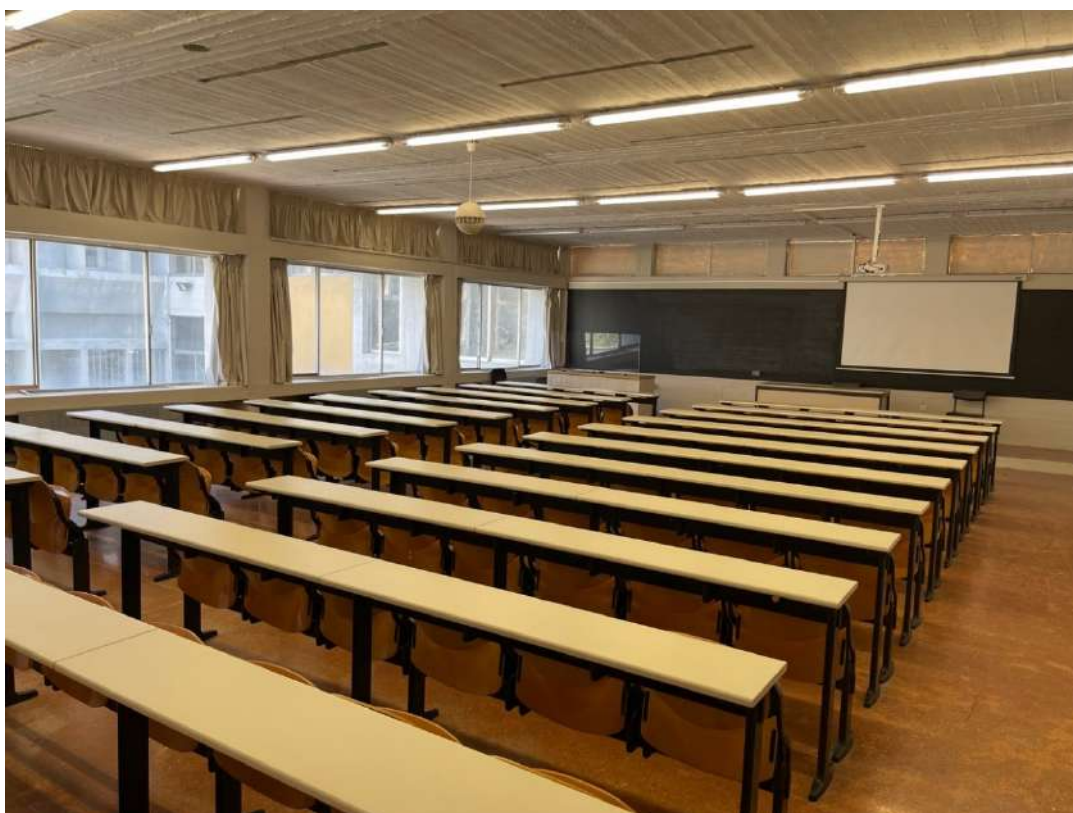
Η Α' Αίθουσα ΜΕΤΑ.