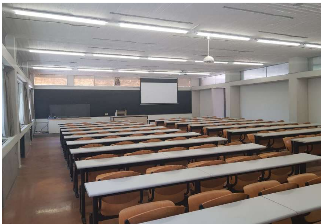
Η ανακαινισμένη Γ΄ Αίθουσα της Θεολογικής Σχολής του ΕΚΠΑ.

Το πρόγραμμα εκσυγχρονισμού των υποδομών της Θεολογικής Σχολής Αθηνών συνεχίζεται με αδιάλειπτους ρυθμούς. Εν όψει της νέας ακαδημαϊκής χρονιάς η Κοσμητεία -με την αρωγή των Τμημάτων Θεολογίας, Κοινωνικής Θεολογίας και Θρησκευολογίας, καθώς και των Συντονιστικών Επιτροπών των Μεταπτυχιακών Προγραμμάτων Σπουδών- προέβη στην πλήρη ανακαίνιση της Α΄ και της Γ΄ Αίθουσας της Θεολογικής Σχολής.