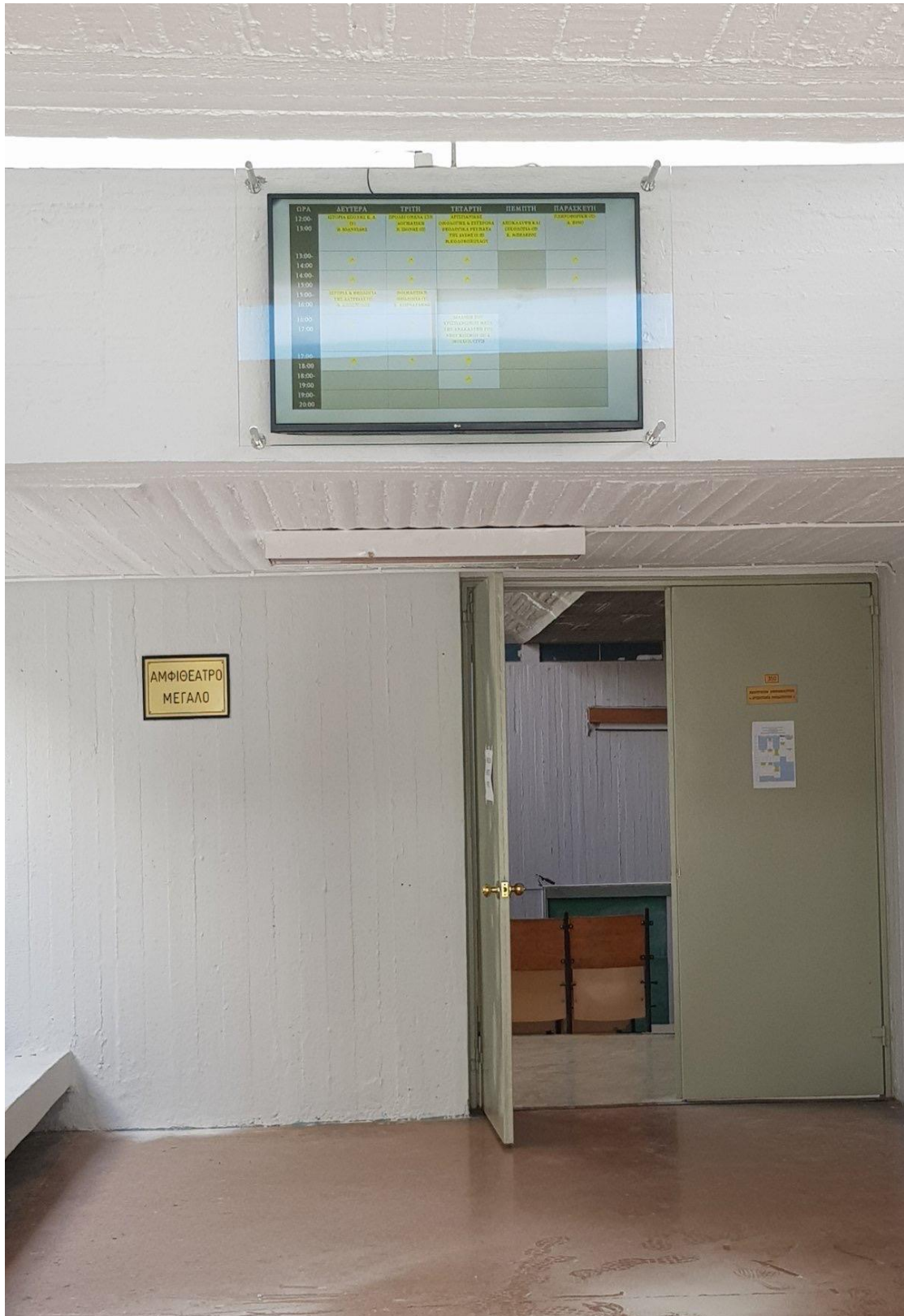
Η οθόνη στο Κεντρικό Αμφιθέατρο με το ωρολόγιο πρόγραμμα διδασκαλίας.