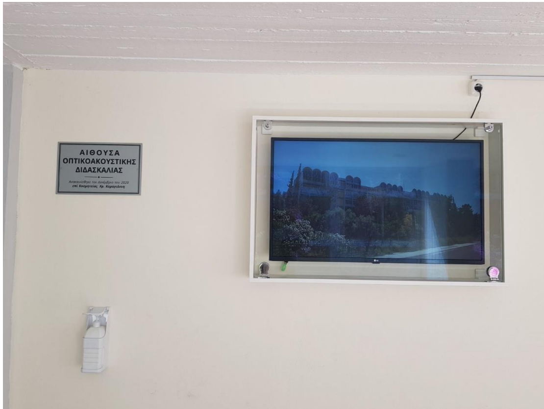
Η οθόνη στην Α΄ Αίθουσα Οπτικοακουστικής Διδασκαλίας.