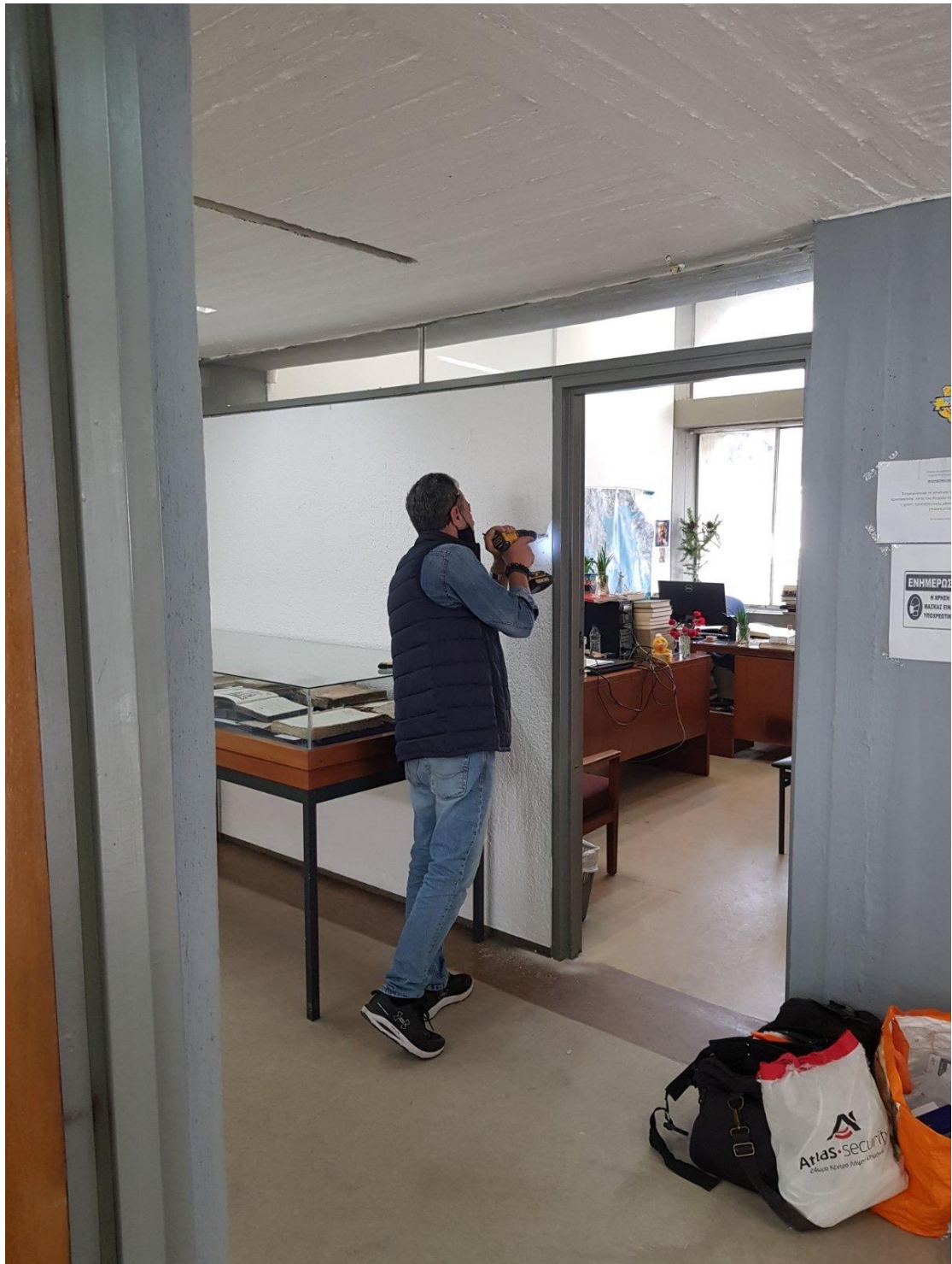
Οι συλλογές της ιστορικής βιβλιοθήκης της Θεολογικής Σχολής πλέον φυλάσσονται με νέο σύστημα συναγερμού.