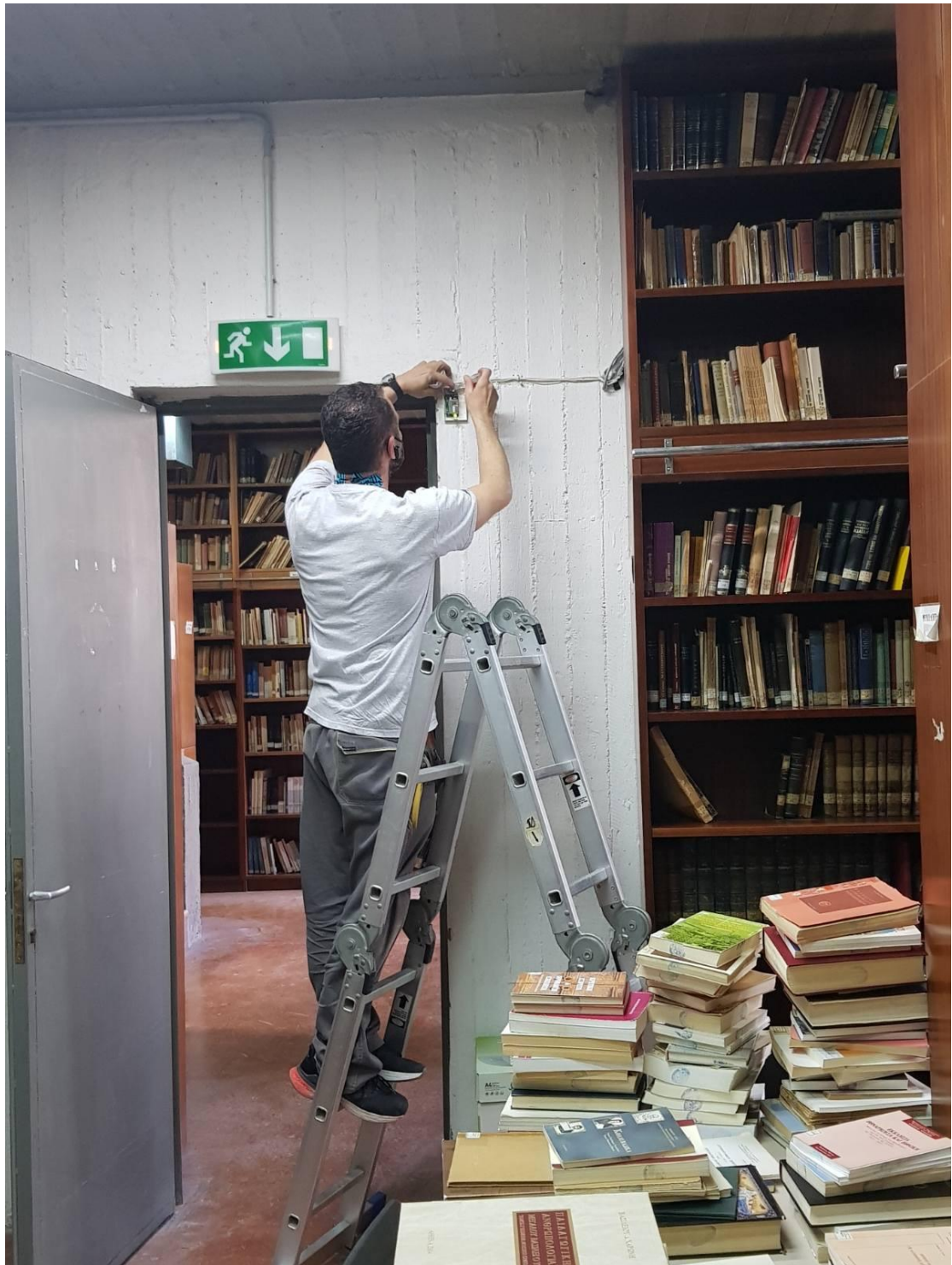
Τοποθέτηση συναγερμού στον υπόγειο χώρο της Βιβλιοθήκης.