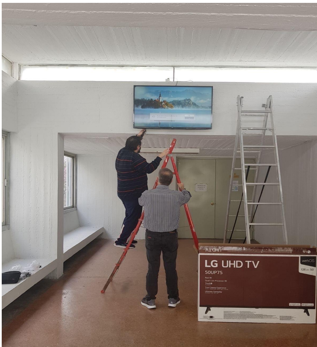
Στιγμιότυπο από την τοποθέτηση και ρύθμιση της οθόνης του Κεντρικού Αμφιθεάτρου.