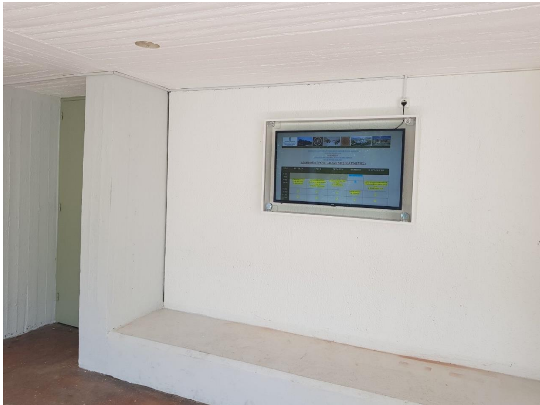
Η οθόνη στο Β΄ Αμφιθέατρο με το ωρολόγιο πρόγραμμα διδασκαλίας.