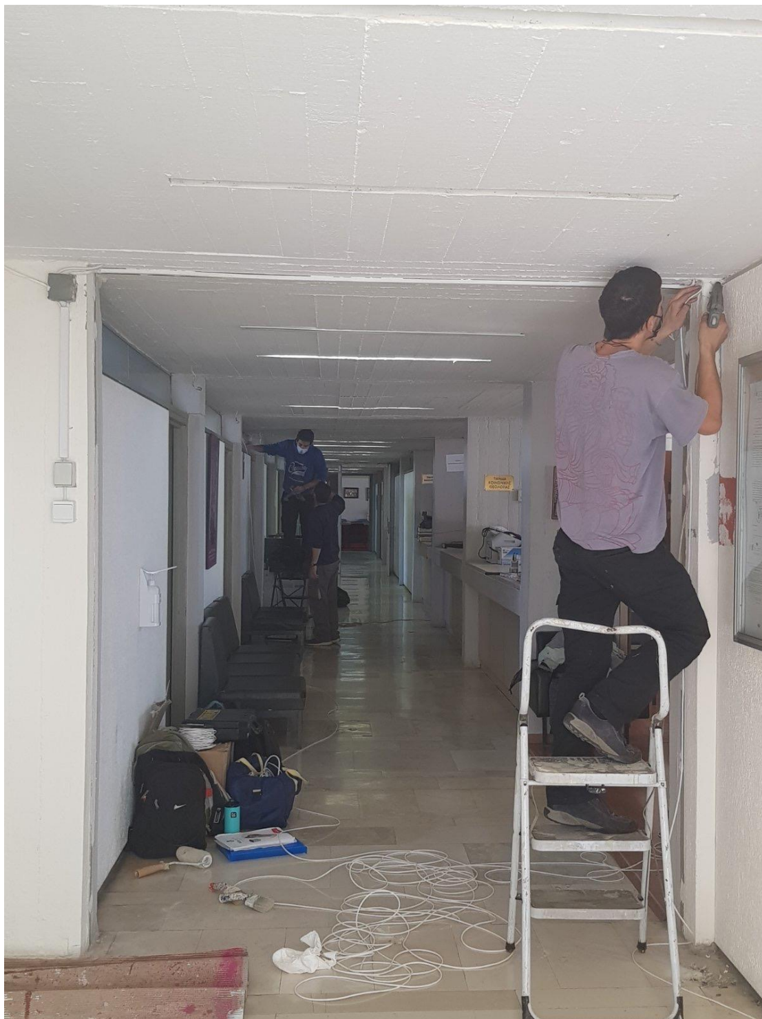
Στιγμιότυπο από την τοποθέτηση του συναγερμού στη Γραμματεία της Σχολής.