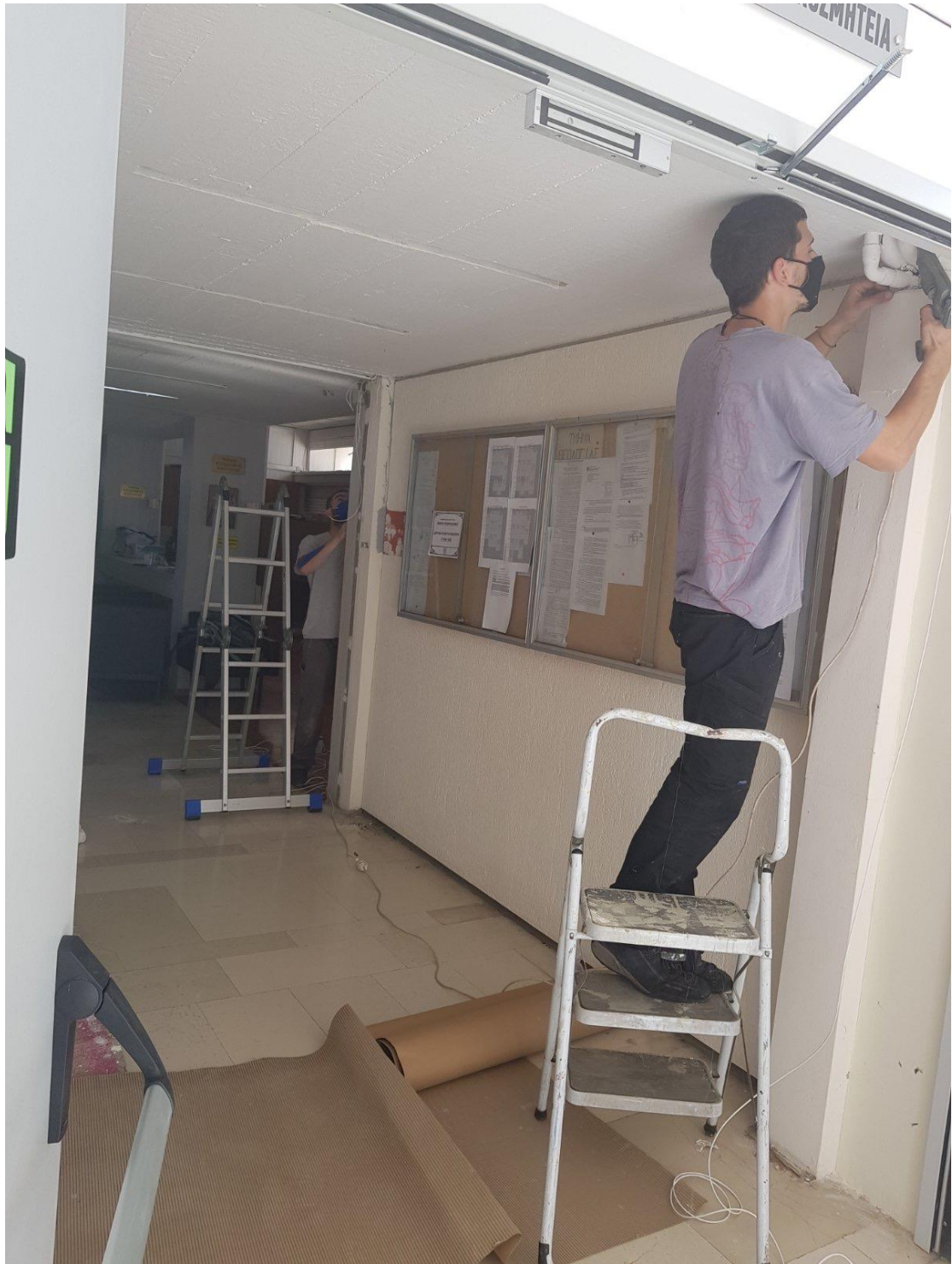
Η Γραμματεία της Σχολής αποκτά νέο σύστημα συναγερμού.