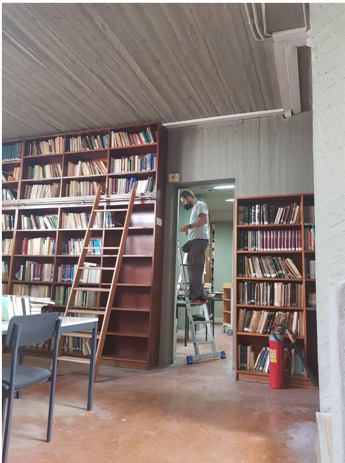
Τοποθέτηση συναγερμού σε όλους τους χώρους της Βιβλιοθήκης της Σχολής.