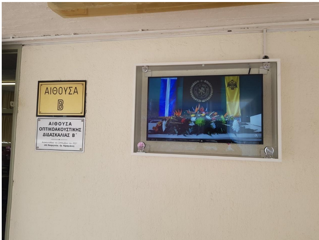
Η οθόνη στη Β΄ Αίθουσα Οπτικοακουστικής Διδασκαλίας.