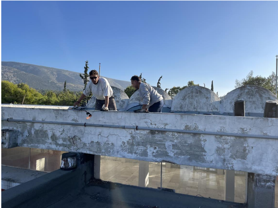
Από τις εργασίες μόνωσης – στεγανοποίησης του κτηρίου της Θεολογικής Σχολής.