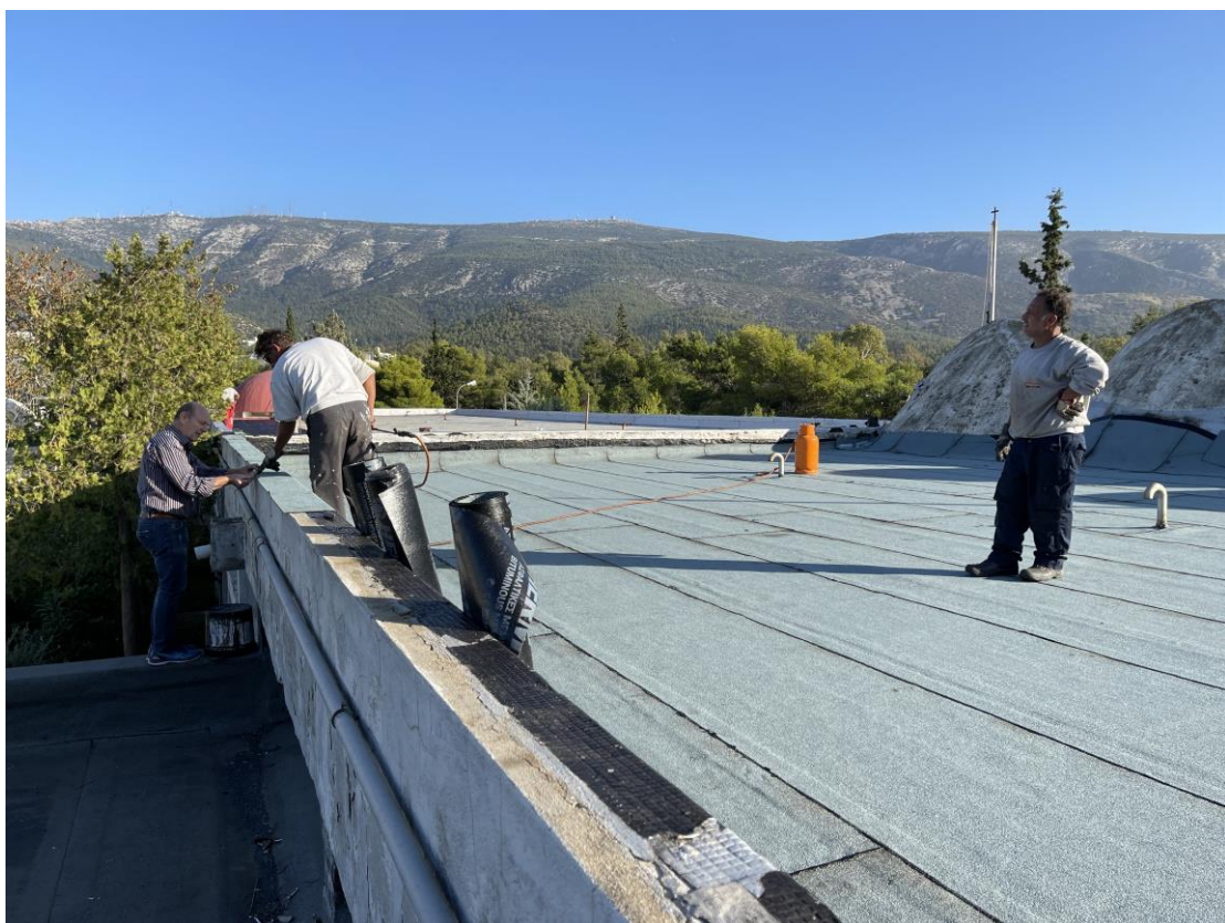
Στιγμιότυπο από τη μόνωση – στεγανοποίηση της οροφής.