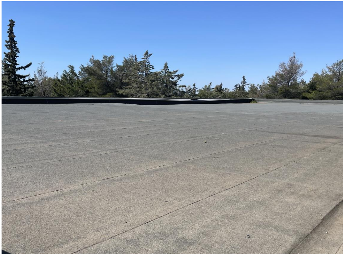
Η από άκρου εις άκρον μόνωση – στεγανοποίηση της ταράτσας.