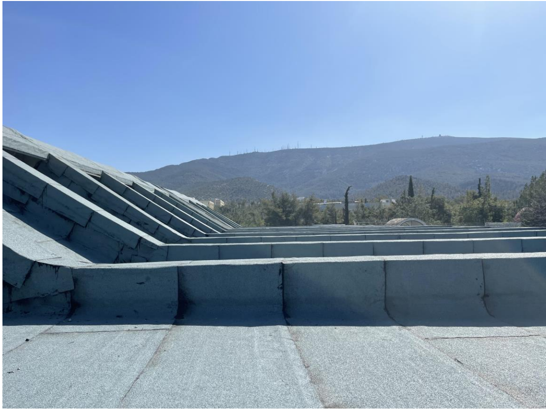
Η μόνωση - στεγανοποίηση πάνω από το Κεντρικό Αμφιθέατρο της Θεολογικής Σχολής.